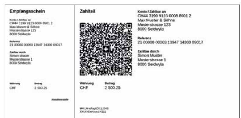
Abbildung «Die QR-Rechnung»

Die Schweizer Finanzinstitute haben ihre Mobile- und E-Banking-Lösungen entsprechend angepasst, damit Rechnungsempfänger ihre QR-Rechnungen bequem einscannen und zahlen können – ganz gleich, ob als Privatperson oder als Unternehmen. Die QR-Rechnung kann auch in den Poststellen verwendet und per Zahlungsauftrag im Couvert an die Bank versandt werden.