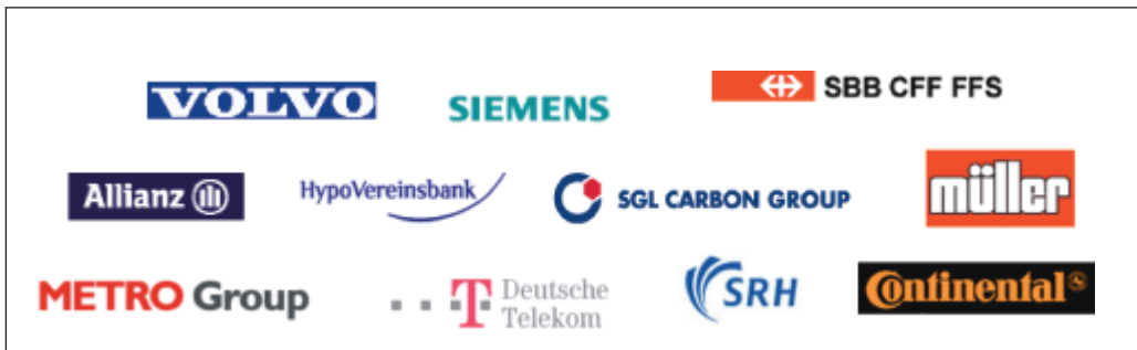
Auszug unseres Kundenstammes